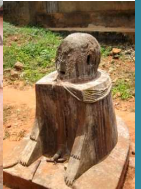
VODOU DE TOGOVILLE