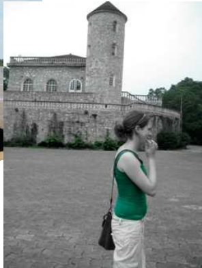
CHATEAU VIAL SUR LA MONTAGNE