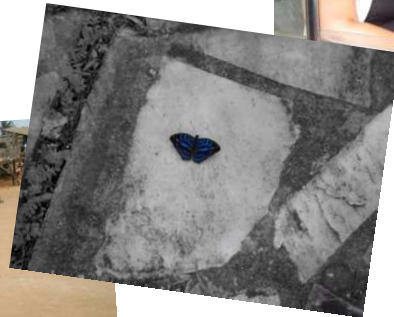
TRAITEMENT DES PAPILLONS