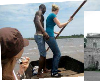
SUR LE LAC TOGO